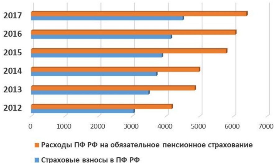
Рисунок 1 - Соотношение расходов Пенсионного фонда РФ на обязательное пенсионное страхование и поступлений страховых взносов в 2012-2017 году (млрд руб.) [23]

ОФОРМЛЕНИЕ СПИСКА ЛИТЕРАТУРЫ. Список литературы (библиографический список) включает содержит источники (ресурсы), которые были изучены и использованы обучающимся при написании курсовой работы. Ресурсами являются все виды опубликованных и неопубликованных работ на любых физических носителях и/или в информационно-телекоммуникационных сетях: книги, сериальные издания, нормативные и технические документы, электронные ресурсы и др.